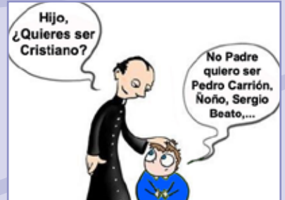
Sentimiento azulino desde la niñez.