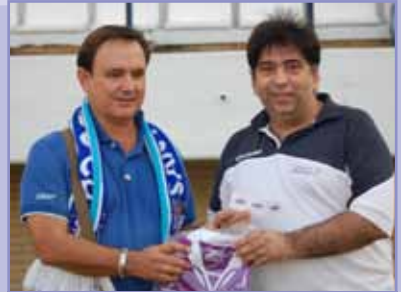
El último ganador del sorteo de las papeletas.