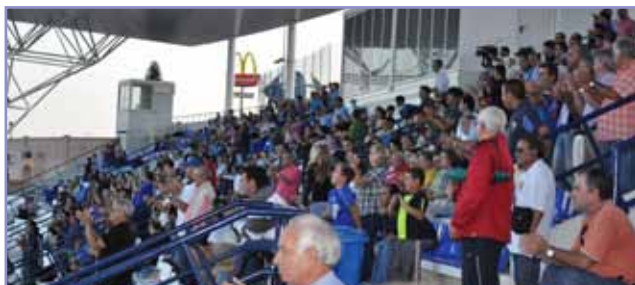
El público en pie en la victoria ante el San Roque