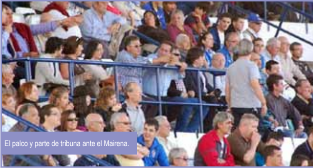
El palco y parte de tribuna ante el Mairena.