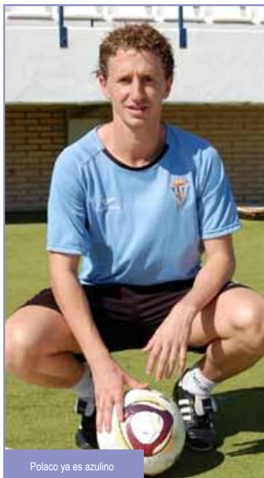
Polaco ya es azulino