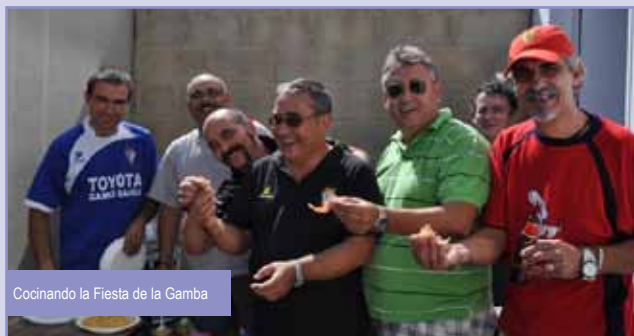
Cocinando la Fiesta de la Gamba