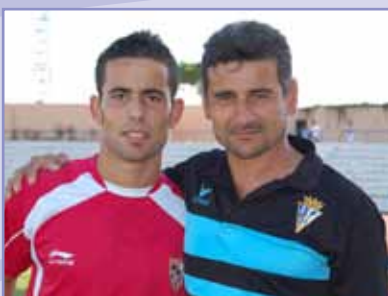
Los Menudo cara a cara