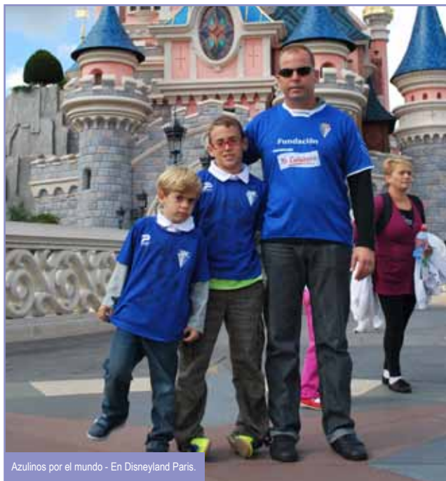
Azulinos por el mundo - En Disneyland Paris.