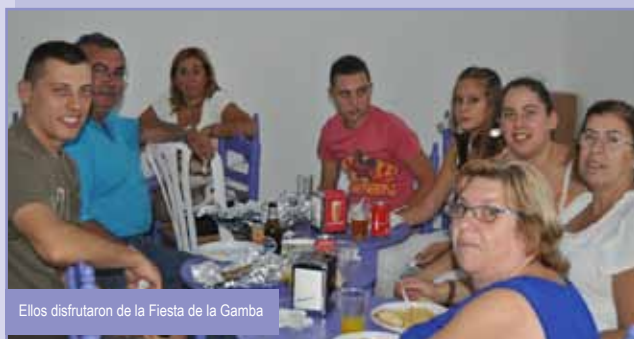
Ellos disfrutaron de la Fiesta de la Gamba